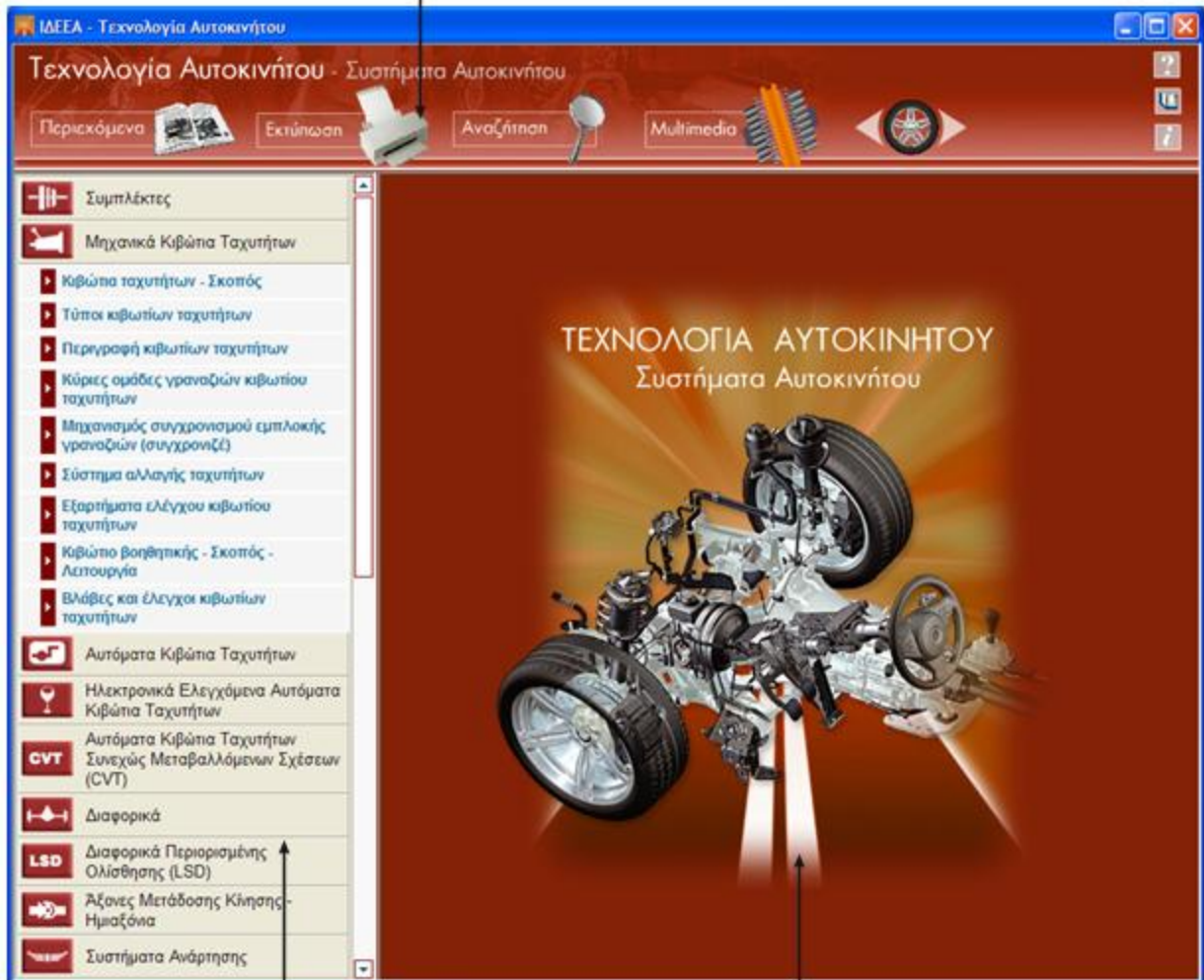
2. Περιεχόμενα / Αναζήτηση (αριστερό πλαίσιο)